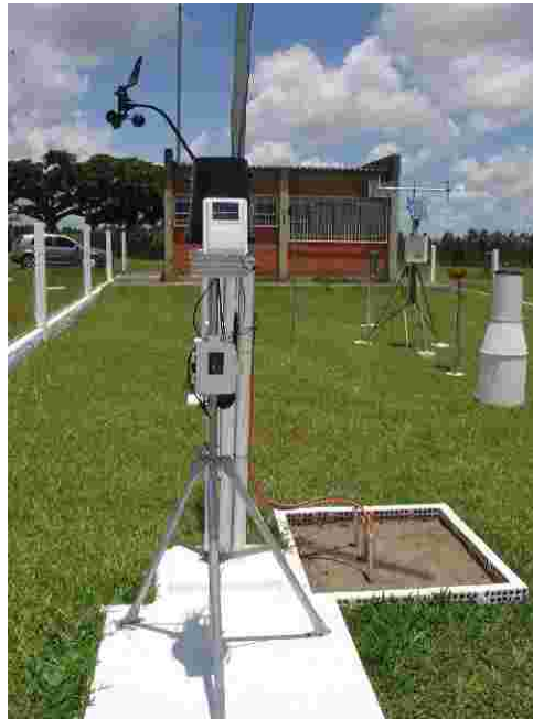
Figura 01 – Estação meteorológica automática (EMA).

A EMA pode ser acessada através do site da Embrapa Clima Temperado ( http://www.cpact.embrapa.br ) clicando, primeiramente, no link à esquerda “Laboratórios” e em seguida em “Agrometeorologia” ou, diretamente, através do link do LA ( http://www.cpact.embrapa.br/agromet ).