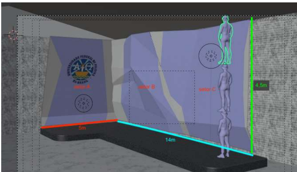
Figura 1 - Projeto base do muro

A figura 1 mostra o projeto base do muro de escalada servindo como ponto de partida para o projeto final, podendo sofrer pequenas alterações no projeto final conforme sugestões da contratada ou da contratante, caso tais mudanças resultem em ganho técnico ao equipamento e não descaracterizem o objeto da licitação, bem como a escolha das cores a serem usadas no acabamento. O diagrama marca 3 setores, onde o setor A deve possuir uma inclinação negativa de aproximadamente 30^\circ fazendo conexão com setor B, configurando um diedro, este setor deverá ter inclinações negativas variadas, possibilitando a montagem de boulders de teto e de força. Já o setor C terá inclinações positivas de 3^\circ . A altura poderá variar conforme a configuração das inclinações, não sendo menor que 4,5m. O setor A, parede do canto esquerdo tem 5m de largura, e o comprimento da parede do fundo, setor B + C tem 14m totais.