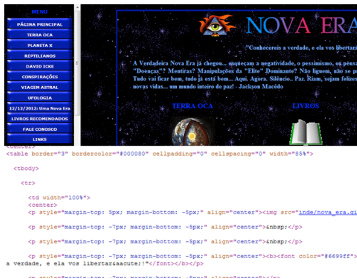
Figura 01 – Captura do site Uma Nova Era, exemplificando um site com uso de <tables> .

A tag <table> foi inicialmente concebida para aplicações semelhantes às do Microsoft Excel , para criação de tabelas em geral. Porém seu uso ficou mais conhecido como ferramenta de design de páginas, numa época inicial do HTML, até a popularização do CSS.